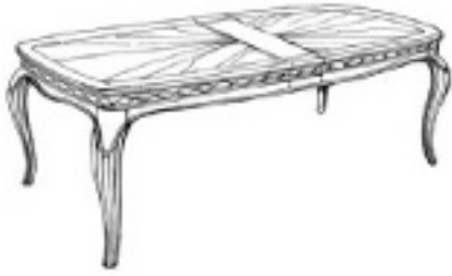
77270 LEG TABLE Extends to 110 inches, includes two 18 inch leaves. 74 x 44, Ht. 30 in. (29 cu. ft.) TABLE 280 cm avec deux rallonges de 45 cm. 188 x 112, H 76 cm