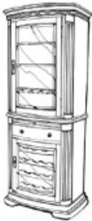
77274 CELLARETTE Two doors, one drawer and pull-out surface. Bottle and stemware storage, touch hinge lighting. 32 x 19, Ht. 82 in. (42 cu. ft.)