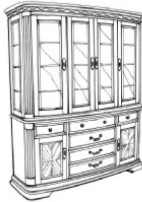
77275 CHINA Four doors, can lights with touch hinge lighting. Glass shelves with plate grooves. Base features six drawers, silver drawer and two doors. 68 x 21, Ht. 82 in. (96 cu. ft.)