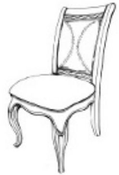
77278 SIDE CHAIR Leather upholstered. 21 x 25, Ht. 41 in. (5.88 cu. ft.) CHAISE Tapisser en cuir. 53 x 64, H 104 cm