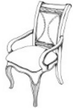
77277 ARM CHAIR Leather upholstered. 23 x 25, Ht. 41 in. (5.88 cu. ft.) FAUTEUIL Tapisser en cuir. 58 x 63, H 104 cm